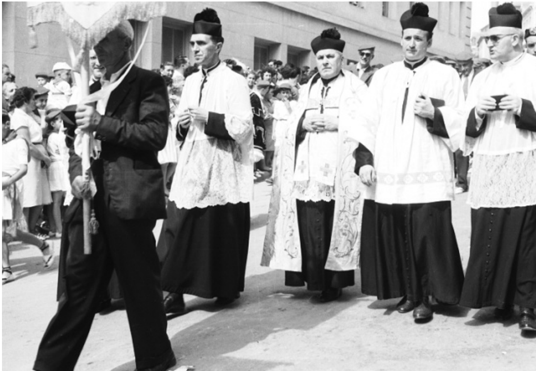
Eliz kabildoa Alardearen atzetik.

Baina Alardea jai ekitaldi bat zen eta hori zela eta, diktadurak kontrolatu beharreko lasaialdiak eragin zitzakeen. Horregatik, 1944an hasi zen idazten San Martzial Alardearen lehenengo Ordenantza. Hartan ezartzen ziren trantsizio garaira arte arautuko zuen Alardearen interpretazio historikoaren oinarriak: Alardearen jatorria 1522ko guduan kokatzen zen eta osagai "espainiarra" eta erlijiokoa zuen. Garaipenaz hitz egiten zenean, "gutziz espainiar" adjektiboa erabat nabarmentzen zen, baita "frantziar tropelaren aurkakoa" zela ere.